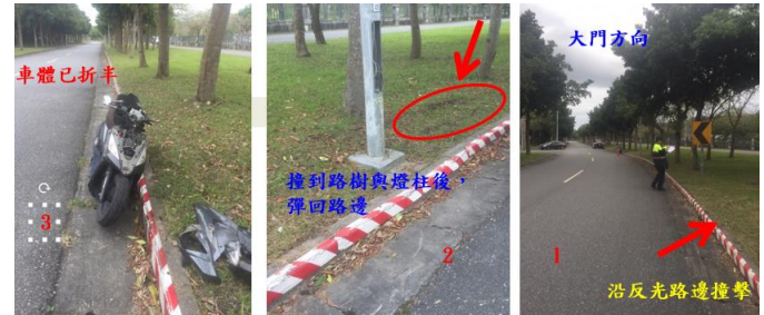
< 圖六:105/12/28 車禍示意圖 >