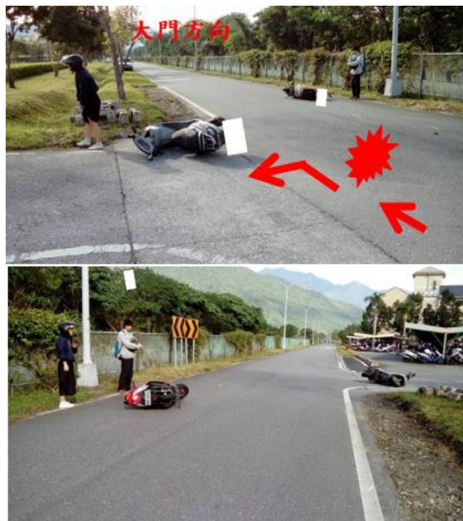
< 圖七:105/12/20 車禍示意圖 >