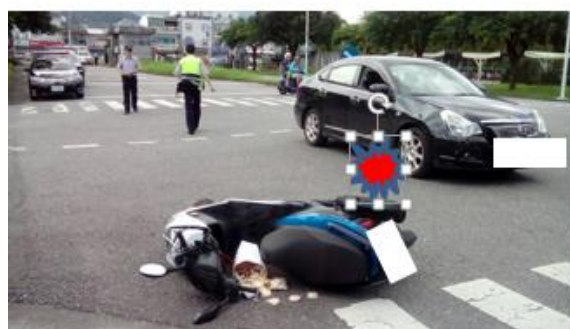
&lt; 圖二十一:105/06/25-2 車禍示意圖 &gt;