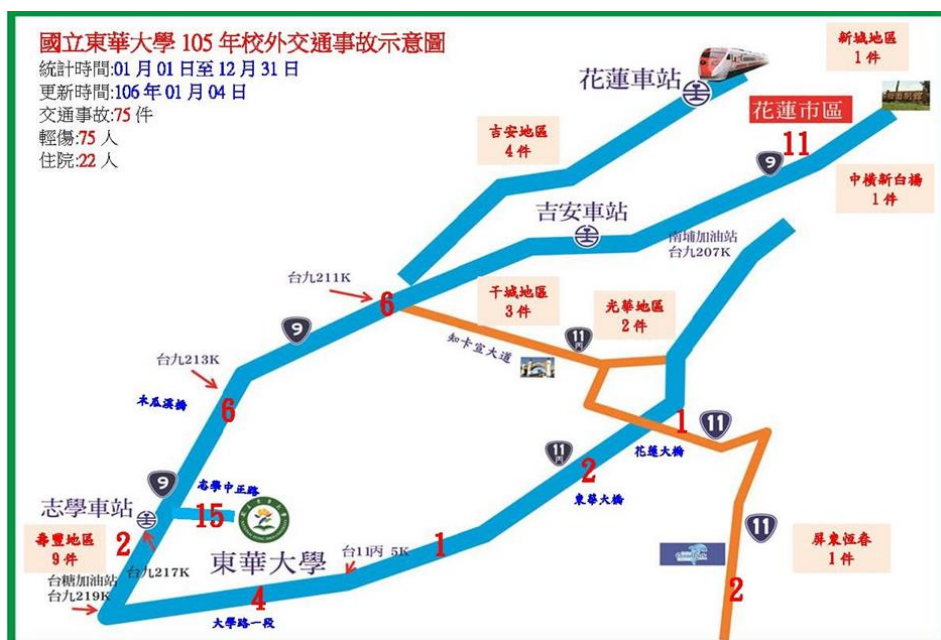
< 圖三:校外車禍地點分布示意圖 >