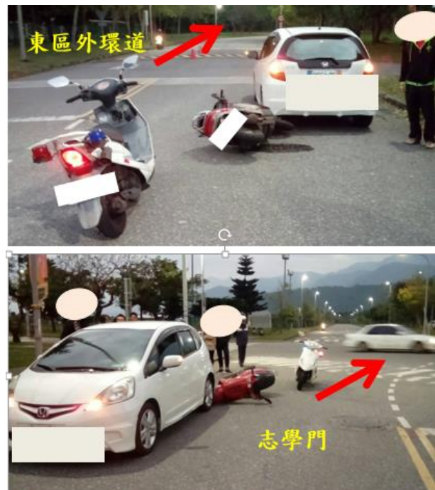
< 圖八:105/12/18 車禍示意圖 >