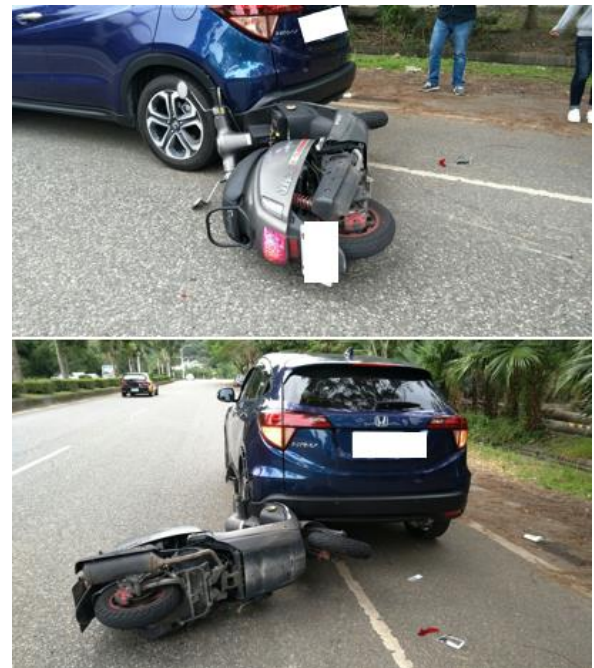
&lt; 圖二十六:105/12/31 車禍示意圖 &gt;