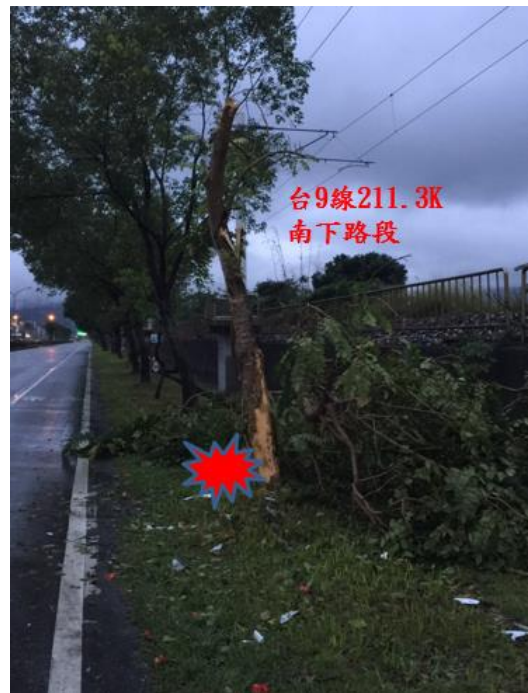
< 圖三十二:105/01/29 車禍示意圖 >