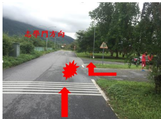
< 圖十五:105/10/09 車禍示意圖 >