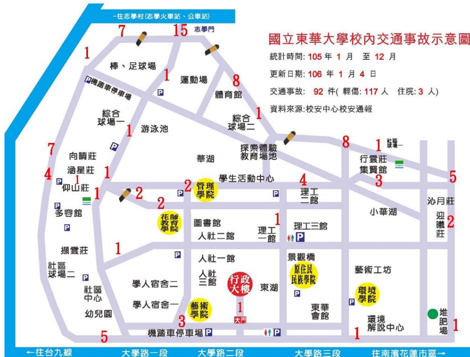
< 圖二:校內車禍地點分布示意圖 >