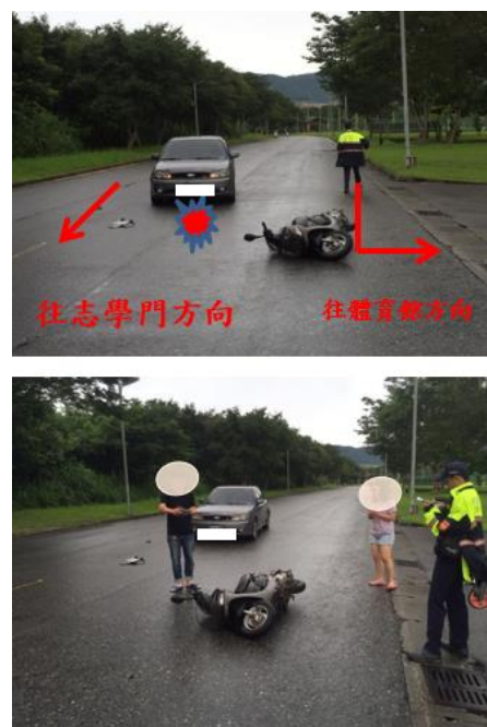
< 圖二十三:105/06/13 車禍示意圖 >