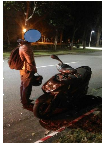
< 圖四：105/12/30-1 車禍示意圖 >