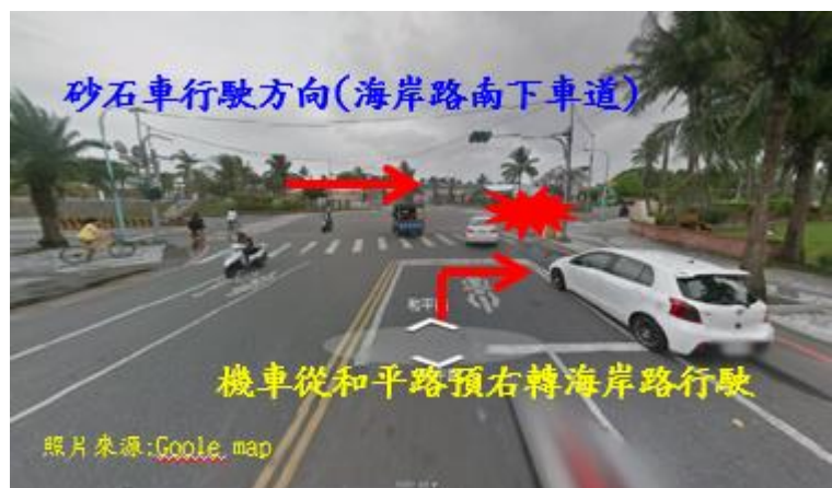
&lt; 圖二十七:105/12/03 車禍示意圖 &gt;