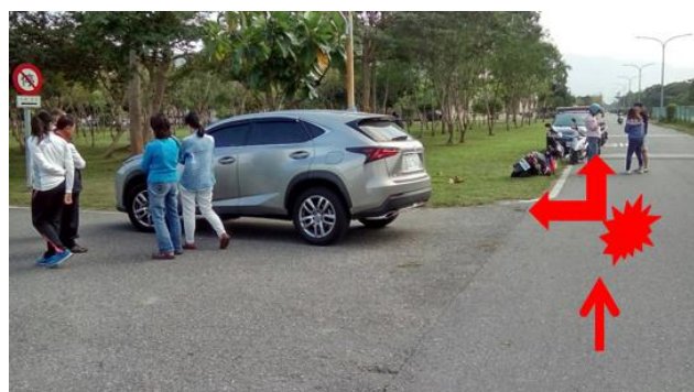
< 圖九:105/12/17 車禍示意圖 >