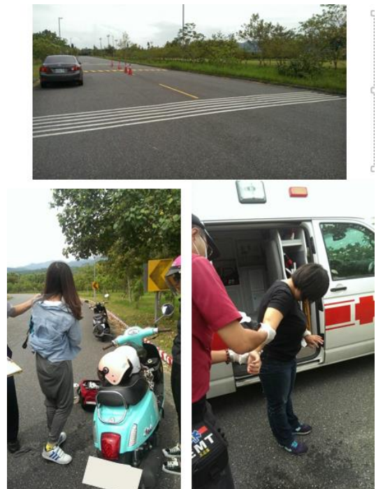
< 圖十七:105/09/06 車禍示意圖 >