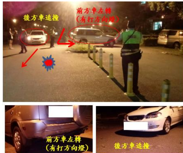
< 圖二十二:105/06/16 車禍示意圖 >