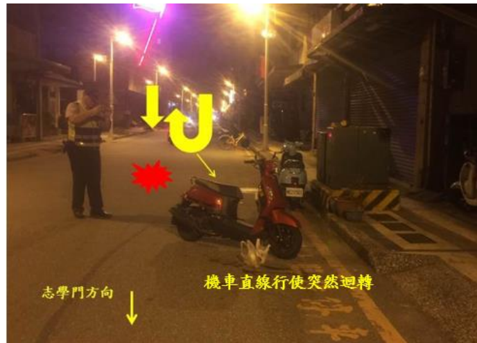
< 圖二十八:105/10/28 車禍示意圖 >