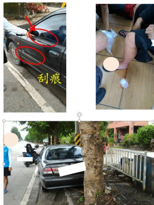
< 圖二十九:105/9/18 車禍示意圖 >