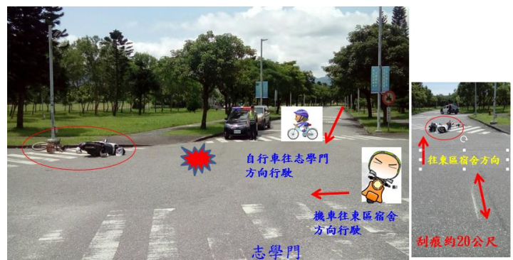
< 圖二十五：105/05/18 車禍示意圖 >