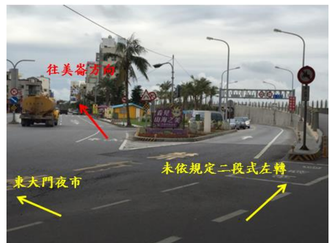
< 圖三十一:105/01/22 車禍示意圖 >