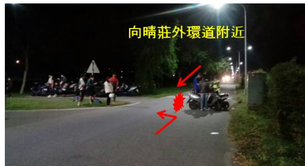
< 圖十三：105/11/15 車禍示意圖 >