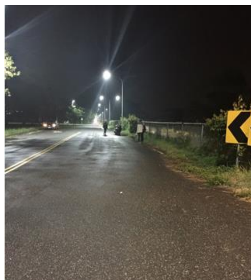
< 圖十：105/11/30-1 車禍示意圖 >