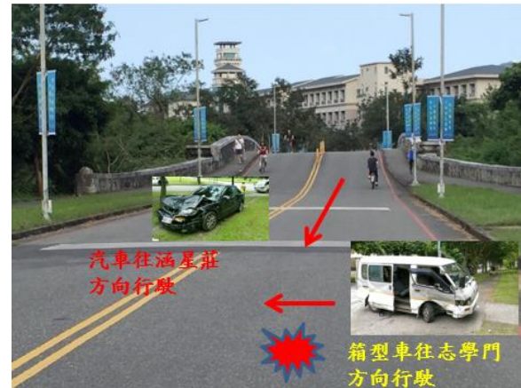
< 圖二十四：106/05/20 車禍示意圖 >