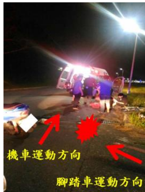
< 圖五：105/12/30-2 車禍示意圖 >