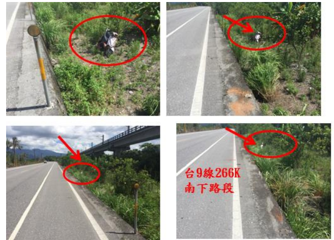
< 圖三十:105/06/24 車禍示意圖 >