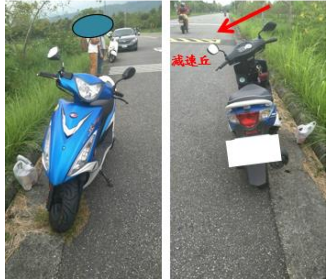
< 圖十六:105/09/13 車禍示意圖 >