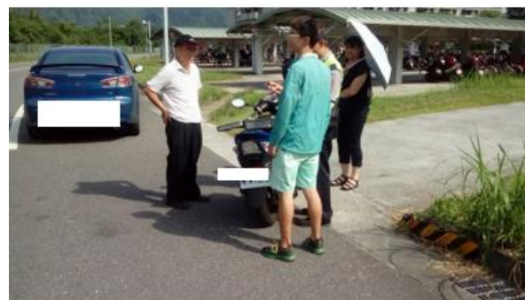
&lt; 圖二十:105/06/25-1 車禍示意圖 &gt;