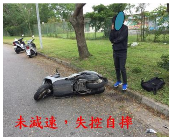
< 圖十一：105/11/30-2 車禍示意圖 >