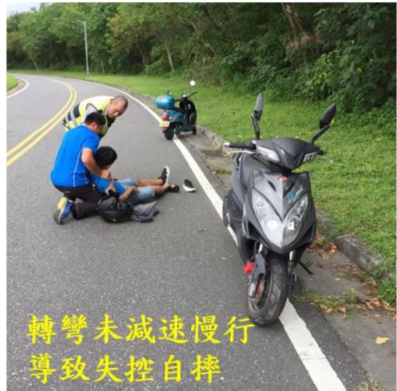
< 圖十二：105/11/21 車禍示意圖 >