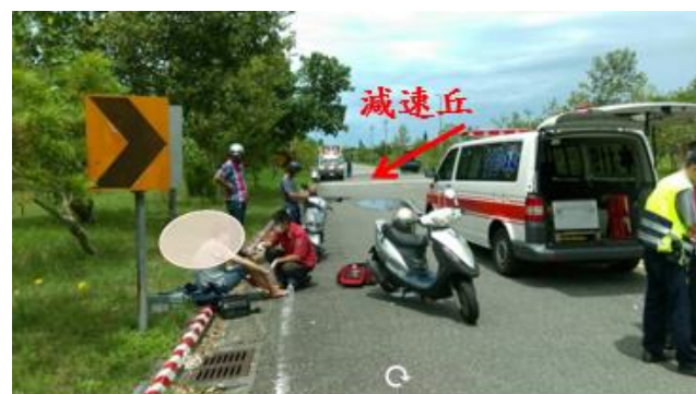
< 圖十九:105/08/12 車禍示意圖 >