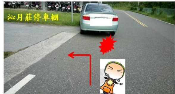
< 圖十四:105/10/11 車禍示意圖 >