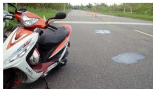
< 圖十八:105/08/21 車禍示意圖 >